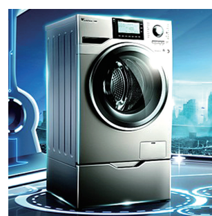
鹅持续引领行业智能技术潮流,极具市场竞争力。

5月1~4日,小天鹅i智能精准投放洗衣机全国巡展郑州站的巡展将于在郑州金博大北门广场举行。此次巡展郑州的消费者可以尽享五重优惠。郑州晚报记者 朱江华