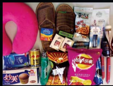
北京粉丝的战斗“装备”!只是,为什么会有奇怪的东西混进来!!!

在电影院里看电视,一看就是24个小时,看的是美剧《24小时》。听起来有点绕,但通宵达旦在影院里看大屏幕的电视剧是什么样的感受?会看哭吗?能坚持到最后吗?美剧《24小时》第九季新开播之际,优酷土豆举办的在电影院24小时看《24小时》的活动好似一个新奇的1:1的小强实验室。在电影院看电视剧在我国电视界是一个新的宣传手段吗?它的花费如何?技术上能保证精度吗?记者专访优酷土豆集团副总裁李黎,TVB企业传讯部副总监曾醒明等贵圈专业人士,来解析如何实现“在电影院看电视剧”的。