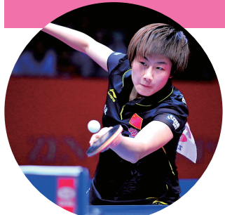
丁宁为女队锁定胜局

不知不觉,昨晚,东京世乒赛已经落幕。为什么不知不觉?因为冷清。哪怕有央视“偏爱”,世乒赛制造的声势,在英超三国杀、欧冠马德里德比、NBA抢七大战面前,着实有些可怜。张继科又立功了,他在1/4决赛“差点输球”,在决赛“终于”输球,几乎是男团一路杀到决赛最大的新闻卖点,大到惊动了蔡振华。对此刘国梁趣评:“打得纠结也有好处,至少可以博个头条。”这就是尴尬所在,眼下只要国乒不被爆冷,世乒赛就没有博头条的资本。世乒赛的看点是什么?可以观察暗潮汹涌的“一哥”、“一姐”之争;可以观察樊振东、朱雨玲这些大赛菜鸟的潜能;可以观察外面的狼,哪些肥了,哪些瘦了。不能否认的是,这些程序化的看点,显得太过自我和狭隘。说白了,世乒赛依然是国乒的练兵场,目的还是为了在奥运会更加万无一失,更加独孤求败。可如此成绩桎梏,显然不利于新形势下,国乒越来越迫切的“三次创业”。