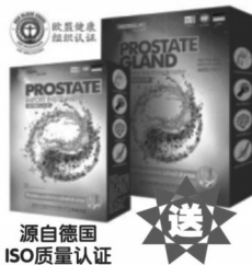
源自德国 ISO质量认证