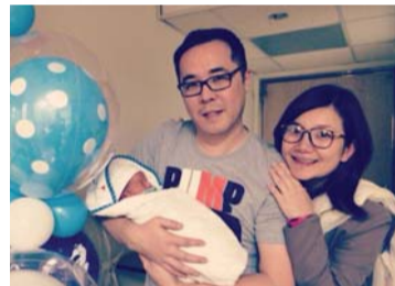
4月27日 此刻感觉真的好幸福呢。