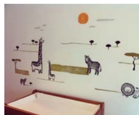
← 2012年10月22日 “我在等你。” → 2012年12月11日 “好想带小子出去奔跑。但他想睡觉。”

2013年3月, 过了半年相夫教子生活的星妈咪孙燕姿产后首次露面, 不仅已经完全修身, 而且身材更加傲人, 尽管还差4公斤才达到昔日43公斤的纸片人身材, 但她笑说每天追着儿子跑, 不担心瘦不回来。果然, 从今年1月持续至今的克卜勒巡演上, 孙燕姿越唱越高, 越战越勇, 这是遛儿子给练出的体力吧, 哈哈! 南都供稿