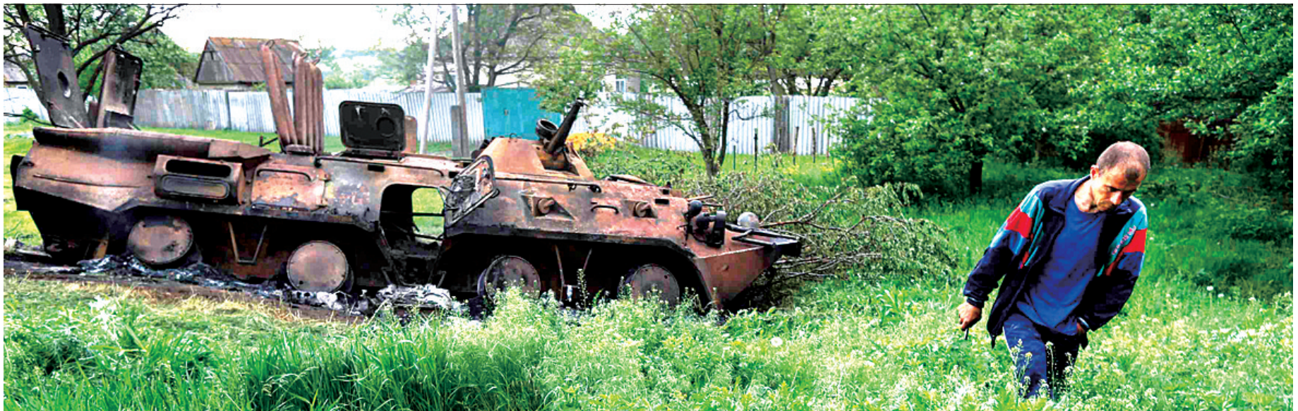
在乌克兰东部顿涅茨克州,一名当地人走过被损毁的乌克兰军队装甲车。