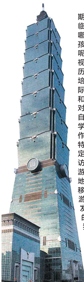
台北101大楼为目前全球最高建筑,搭乘全球最快的观光电梯登上塔顶,可360°观赏台北美丽景色

期盼已久的暑期就要来临了,2014年的暑期去哪儿玩呢?家长您又为孩子准备了哪些惊喜呢?为拓宽孩子的国际视野,丰富孩子的人生阅历,增强孩子的主动性,培养孩子的个性以及国际化、多元化的文化理念和思维习惯;训练孩子相对独立的生存能力、相对自主的理财能力,使他们学会和思考怎样与人合作,郑州晚报新密播报站特招募赴台小记者,量身定制“台湾8日小记者采访团”行程,让孩子们在游中学、学中玩,在与当地学生的交流联欢中潜移默化地取长补短。游学心得本报将择优刊发,相信,孩子此行收获的,不仅仅是欢笑,还有独立生存、自理自立的能力,更有被认可的自信。郑州晚报记者 王银廷