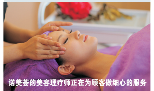
诺美荟的美容理疗师正在为顾客做细心的服务