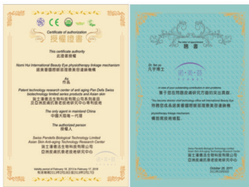
欧盟CE认证及瑞士潘德法授权证书

瑞士潘德法生化科技集团国际部为更好地服务亚洲,在中国香港创办了亚洲皮肤抗衰老研究中心,基于绿色、安全、高效