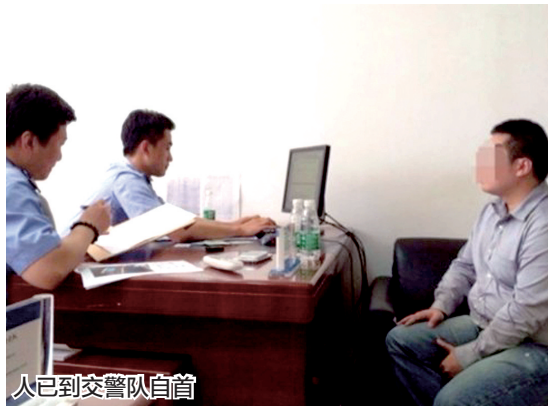
人已到交警队自首