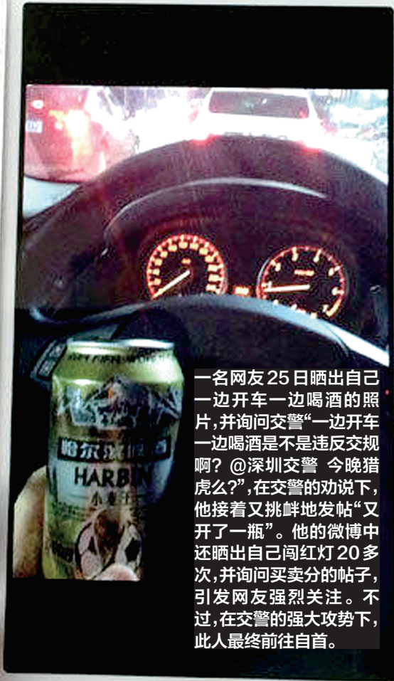
边喝酒边开车边给交警发微博

一名网友25日晒出自己一边开车一边喝酒的照片,并询问交警“一边开车一边喝酒是不是违反交规啊?@深圳交警 今晚猎虎么?”,在交警的劝说下,他接着又挑衅地发帖“又开了一瓶”。他的微博中还晒出自己闯红灯20多次,并询问买卖分的帖子,引发网友强烈关注。不过,在交警的强大攻势下,此人最终前往自首。