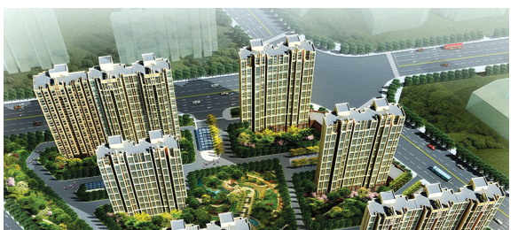
正商·华钻 【楼盘档案】

东南板块崛起的历史,最早可以追溯到2002年正商地产开发的金色港湾,其在东南板块一炮打响,使东南板块声名鹊起。在众多地产大腕“南下东进”安营扎寨东南板块之后,正商地产依然以其实力稳步前行。