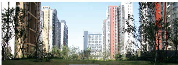
通利紫荆尚都 【楼盘档案】

开发商:河南通利房地产发展有限公司 物业地址:管城区紫荆山路与陇海路交会处南 产品特点:地铁沿线 现房 教育地产