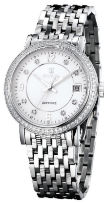
●原价 8760 元 钜惠价 3280 元