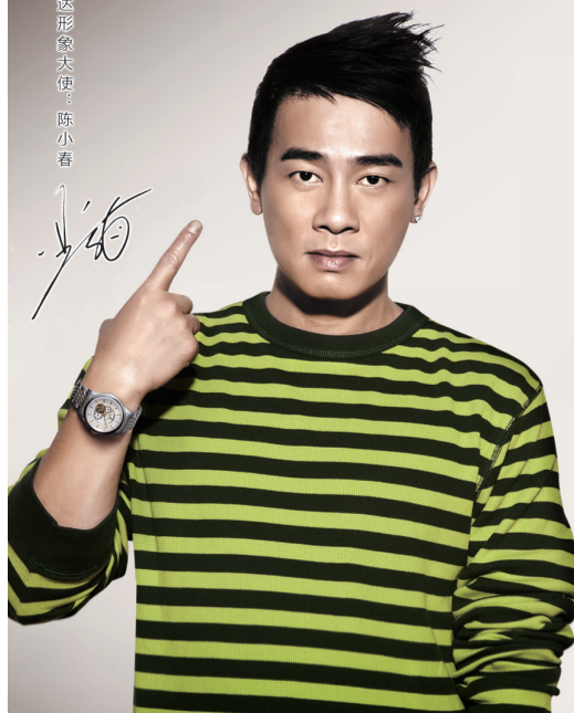
瑞尼达形象大使:陈小春

销,被誉为:“物超所值”,相当于一部普通手机的价格,买到一款好的全自动机械表,这在以前绝对是天方夜谭,不过今天真实地出现了!