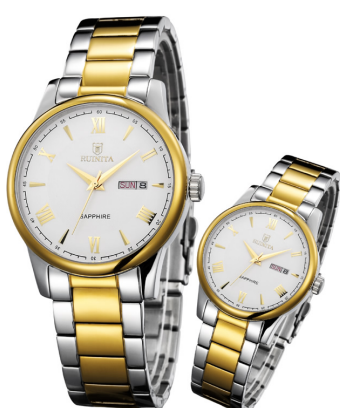
●原价 5560 元 钜惠价 1980 元