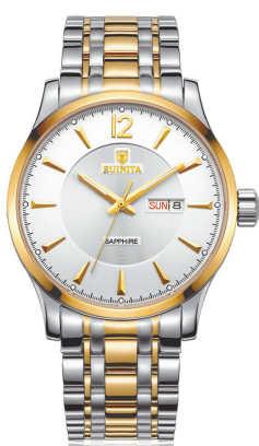
●原价 7180 元 钜惠价 2680 元