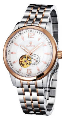
●原价 6370 元 钜惠价 2280 元