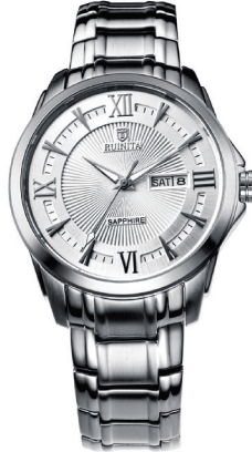
●原价 5870 元 钜惠价 2050 元

爱心提示:夏日炎热,凡是活动期间购买腕表读者,可报销 20 元出租车费或者公交费用