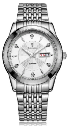
●原价 3999 元 爆款价 999 元