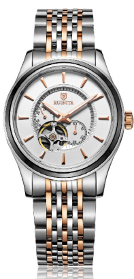
●原价 6390 元 钜惠价 2480 元