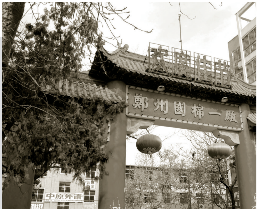
郑州国棉一厂生活区大门

纱的质量达到甲级，不久就可织布，国棉一厂已有部分机器进行试车生产。从本月5日起，这个纺织厂的头道工序清花机部分开始转动，依次开动梳棉、粗纱，到8日开至细纱机，截至11日共开4千纱锭，以后还要继续增多。