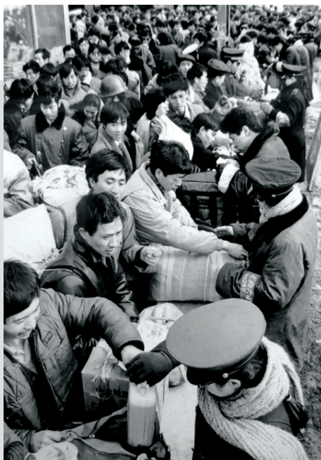
左图：郑州火车站工作人员在站前为乘客进行手工拆包安检（1986年2月摄）