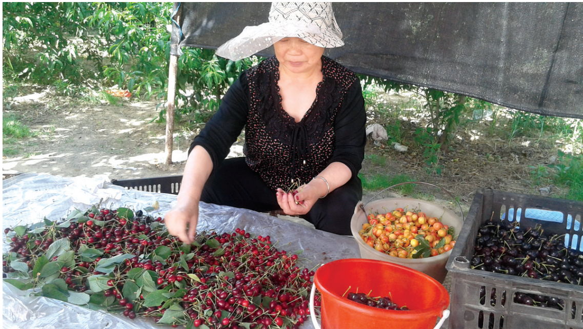
青山绿水红樱桃，欢声笑语采摘忙。又是一年樱桃成熟季，荥阳市乔楼镇李沟村的60余亩樱桃园，吸引不少郑州及荥阳周边市民前来采摘。5月28日，记者在该樱桃园内看到，挂满枝头的红樱桃灿若红星，果园主人正在为前来采摘的市民装箱、称重，忙得不亦乐乎。