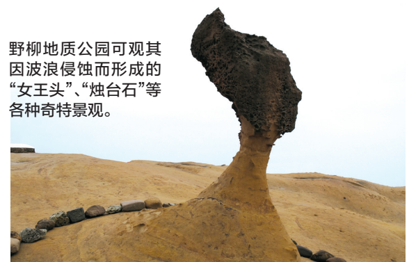
野柳地质公园可观其因波浪侵蚀而形成的“女王头”、“烛台石”等各种奇特景观。