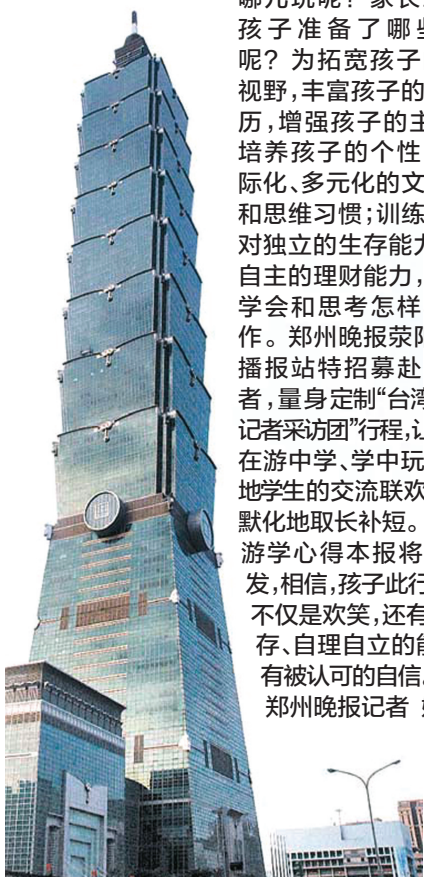
台北101大楼为目前全球最高建筑，搭乘全球最快的观光电梯登上塔顶，可360°观赏台北美丽景色。

招募对象：荥阳、上街在校学生 招募人数：荥阳、上街各限额15人 详情咨询：荥阳 64661111 15837192339 上街 15713830825