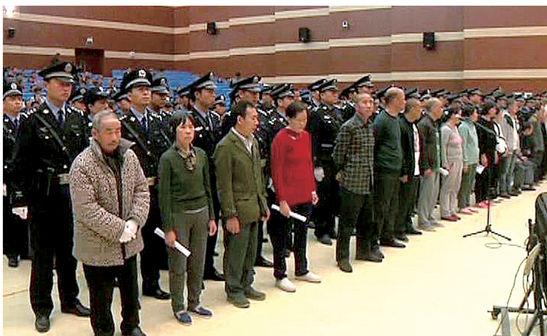
拍于4月25日庭审现场