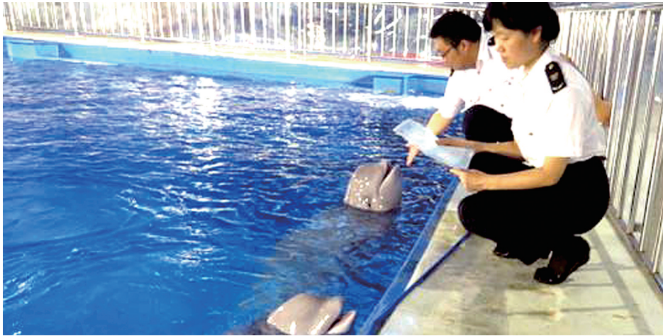
河南检验检疫局工作人员在对白鲸进行检疫监管。

昨日,记者从河南出入境检验检疫局了解到,近日,来自俄罗斯的两只白鲸经过河南出入境检验检疫局为期30天的隔离检疫,合格放行。这是河南出入境检验检疫局首次完成进境水生动物隔离检疫任务。据悉,这是开封东京极地海洋馆以每只80万元的价格,从俄罗斯引入的。