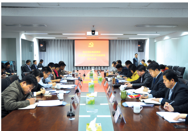
郑州国际物流园区召开党的群众路线教育实践活动动员大会