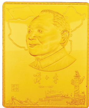
9枚9克纯金肖像金片

想而知! 历来大师巨作都是拍卖会上争夺的焦点,黄永玉一字千金,范曾字画每尺过万,大师本身就是升值的保障。同样的玉雕,换成大师执刀,身价完全不同。奥运玉玺几年涨了50多万,“九龙至尊·邓小平金玉组玺”作为任海洲大师的又一开山力作,连大师本人也说:“这是超越奥运玉玺的完美之作,价值不可估量!”