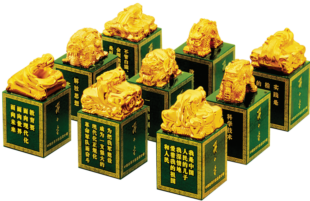
宝印印钮:九大乾隆国宝帝玺 宝玺玺文:九条故宫飞天神龙 宝印印身:9句伟人旷世语录、9幅伟人纯金金像

浮雕镜面工艺,独一无二,国旗、长城、天安门层次分明,将红色伟人的光辉形象完美展现,突破性工艺荣获工艺美术界众多专家好评,可谓众望所归。