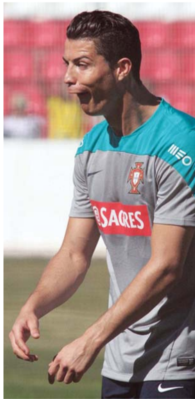
内啥青年欢乐多啊