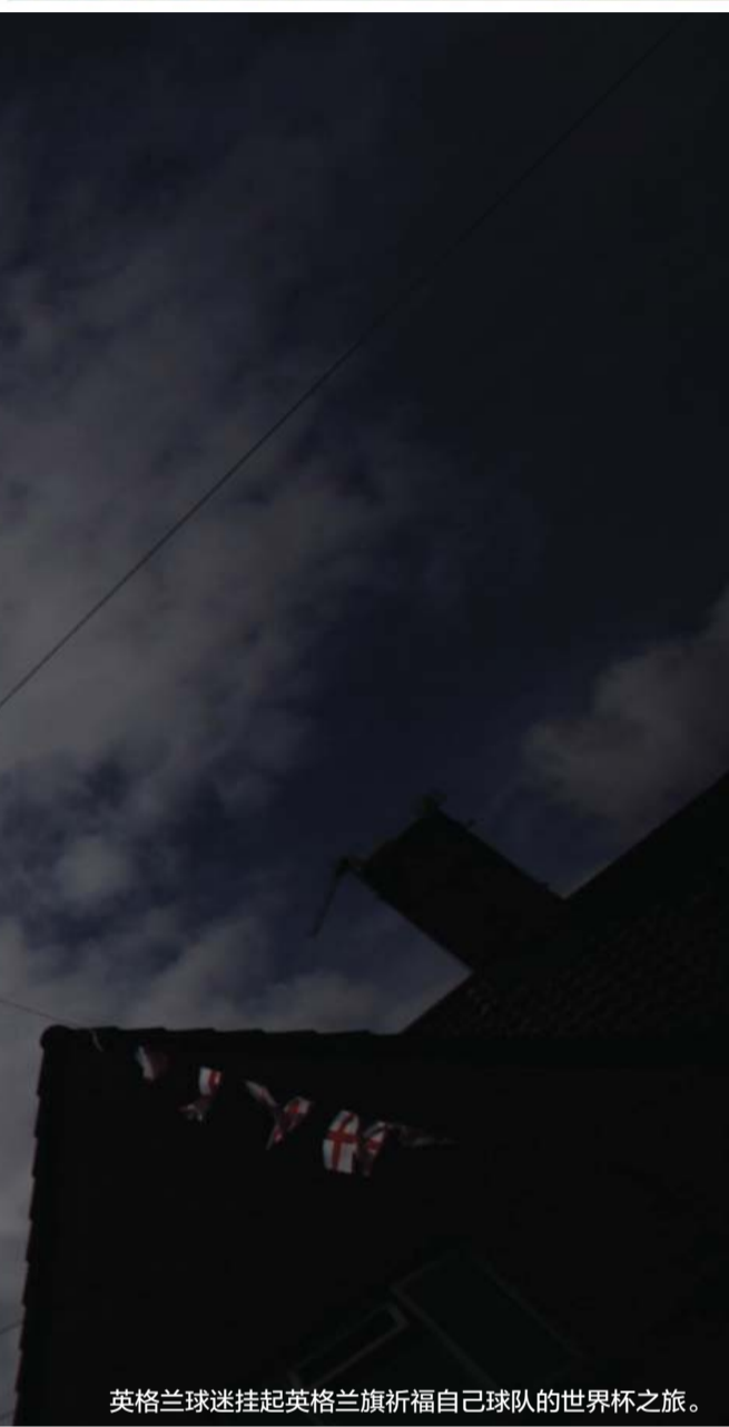
英格兰球迷挂起英格兰旗祈福自己球队的世界杯之旅。