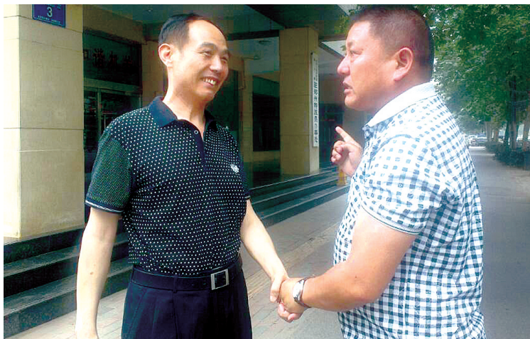
战友见面相谈甚欢