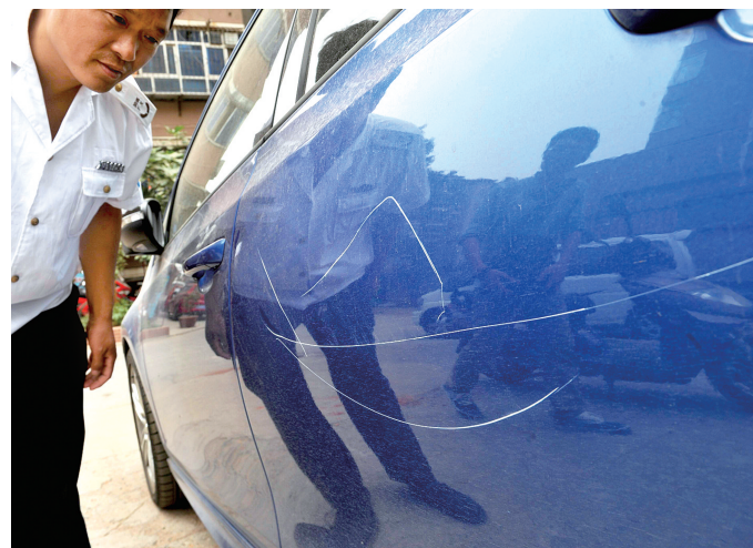
尚未上牌的高尔夫轿车被小区保安划得满身伤痕。

彭先生(稿费50元)来电:丰乐路9号院,有一辆新买的大众高尔夫,车身被划了10多道印痕。 郑州晚报记者 冉小平/文