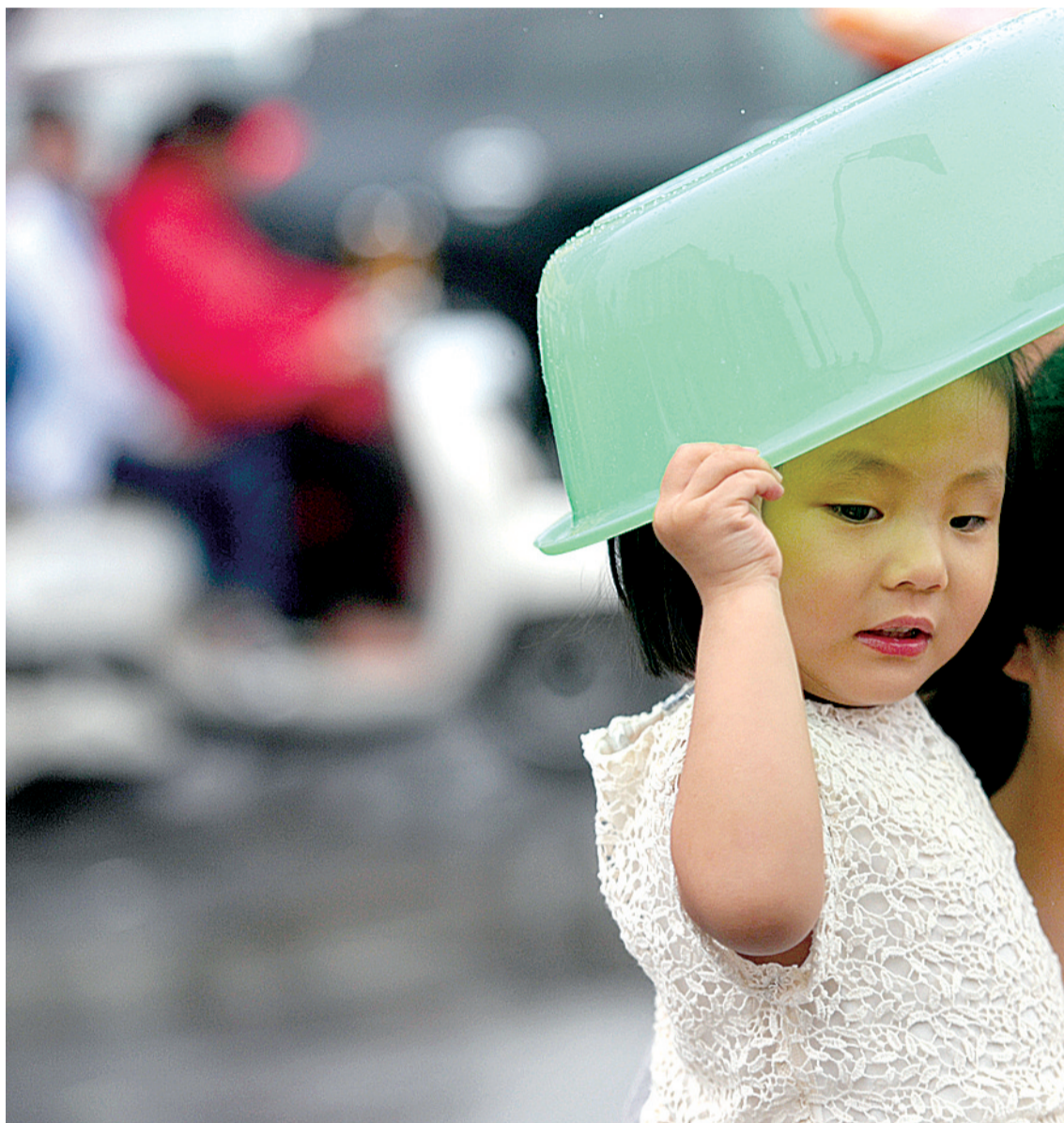
建设路桐柏路口,一位女士怀里的小女孩用塑料盆挡雨,十分可爱。