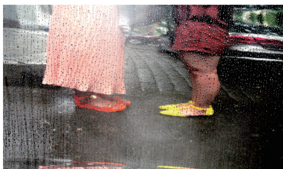
雨滴打在挡风玻璃上