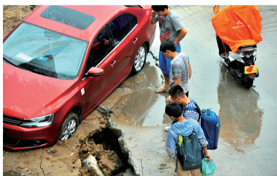
桐柏路陇海路口东北角,一辆私家车陷进坑里。