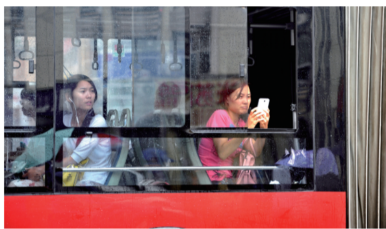
快速公交上的乘客用手机拍摄积水。