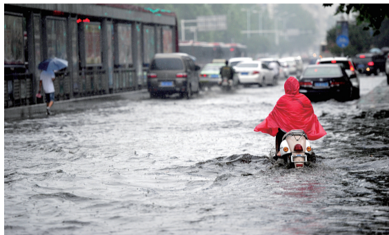
建设路桐柏路交叉口,再次成为积水“重灾区”。