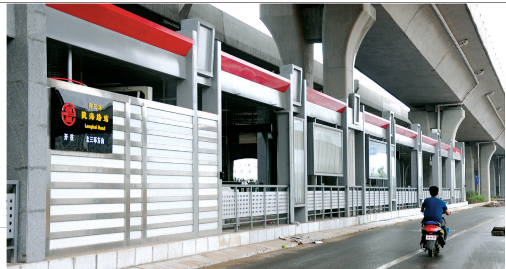
三环的BRT车站已经基本完工,车道也已划好。