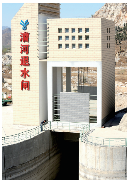
以上三图为漕河渡槽主体工程