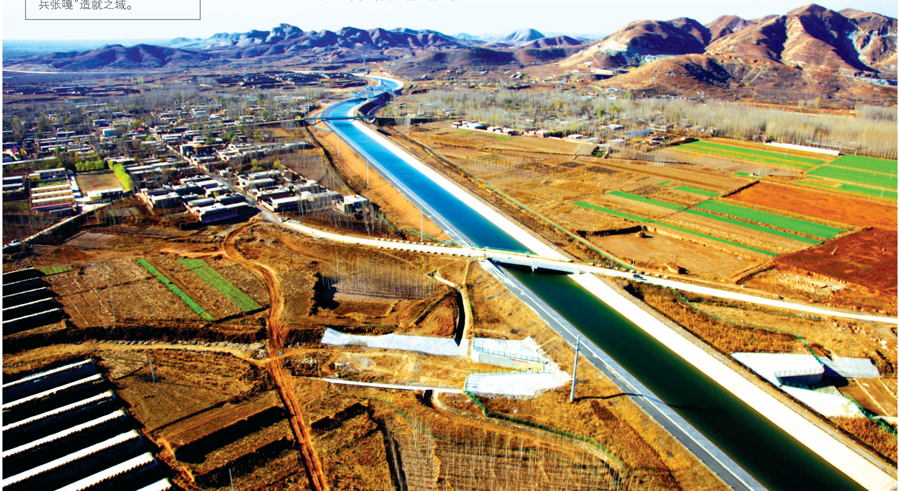
横亘在天际间的漕河渡槽,与山,与天交相辉映,蔚为壮观。

素有“华北明珠”之称的白洋淀总面积366平方公里,地处京、津、石腹地,距离三地150公里左右,曾是帝王巡幸之所、“荷花淀派”诞生之地、雁翎神兵扬威之处、“小兵张嘎”造就之域。