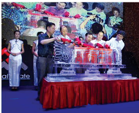
农工商房产集团郑州品牌发布会

26年发展的农工商房产集团，拥有房地产开发企业国家一级资质，连续多年荣膺中国房地产开发50强企业。其开发战略为精耕上海，深耕长三角，辐射全国，足迹遍布上海、江苏、河南等八省市，累计开发总量超2000万平方米。农工商房产始终秉持“最具海派文化的地产企业”的企业愿景，弘扬“农工商房产 海派新生活”的品牌理念，秉承海纳百川，责任稳健，积极创新、坚守品质、敢梦敢想的“海派文化”，为市场提供精致、优雅、创新的精惠海派产品，为客户提供真正高品质家园、健康从容的海派新生活。