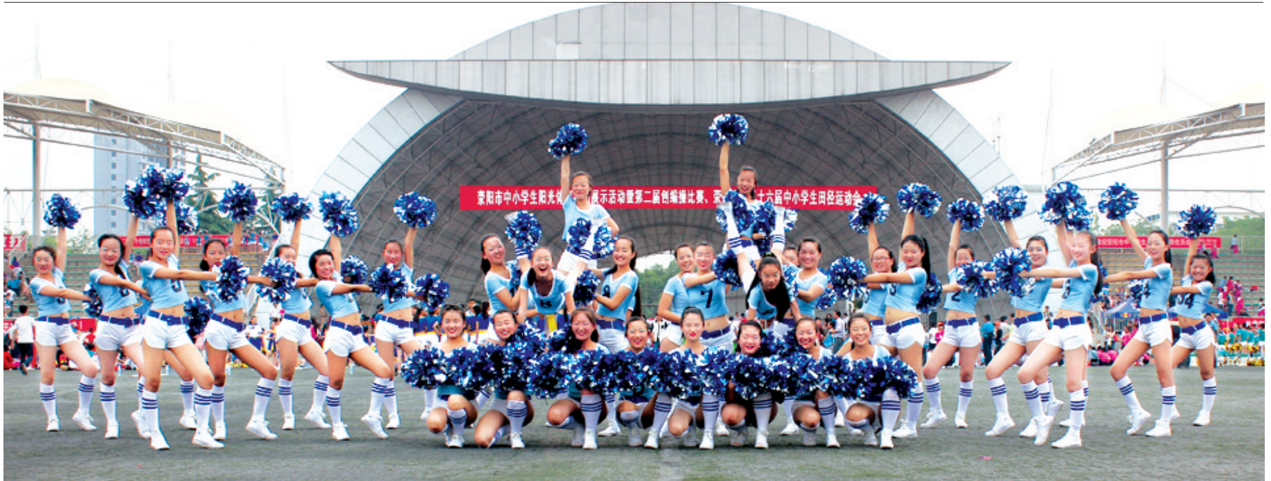
比赛场上,荥阳一中学生表演自编舞