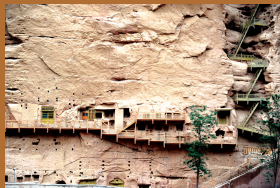
开凿于悬崖之上的甘肃炳灵寺石窟