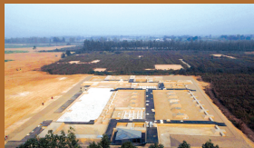
西安的未央宫遗址保护区的“少府遗址”