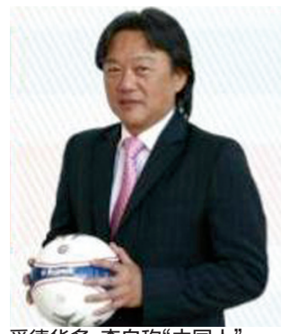
爱德华·李自称“中国人”

回顾起2002年世界杯的那场中哥之战，当时他虽然还不是足协主席，但印象却非常深：“我期待中国足球强大起来，能再次打入世界杯。”