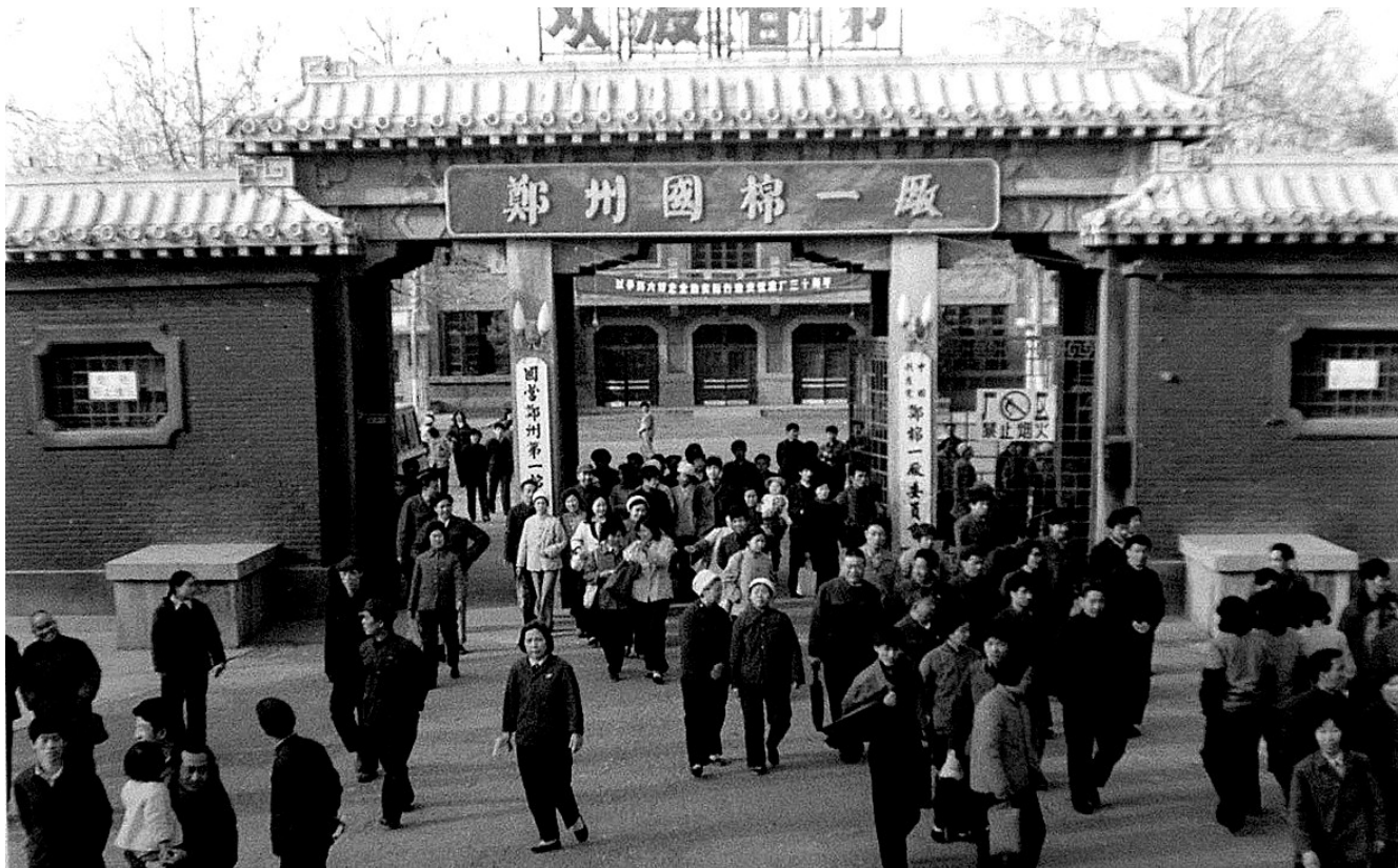
上世纪80年代的郑州国棉一厂。

荥阳青台遗址的发掘,有力的证实:中国丝绸起源于5500年前的郑州。而到了近现代,纺织工业在郑州的城市工业发展史上,更是举足轻重。