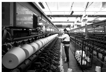
郑州国棉一厂,曾经的生产场景。