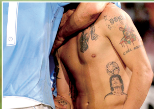
拉韦齐左肋的马拉多纳