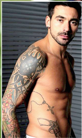
曾引发命案的左轮