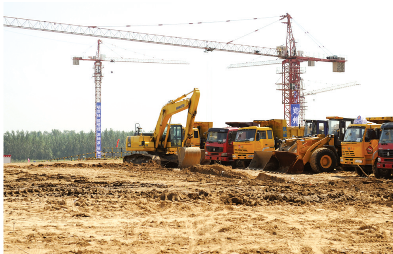
一处即将开工的建设用地。

因网络故障导致5块地推迟出让后,6月份市区仅挂牌出让了两块建设用地。郑州晚报记者昨日从相关部门获悉,今年上半年郑州市区累计挂牌出让各类建设用地6196.11亩。7月份,市区挂牌出让的各类建设用地高达1492.27亩。郑州晚报记者 胡申兵/文