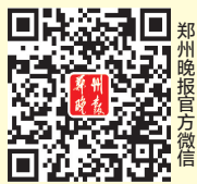
郑州晚报官方微信

即日起关注 郑州晚报官方微信 ,即有机会获得价值 2380元 夏令营名额。详情请关注 郑州晚报官方微信 相关内容。