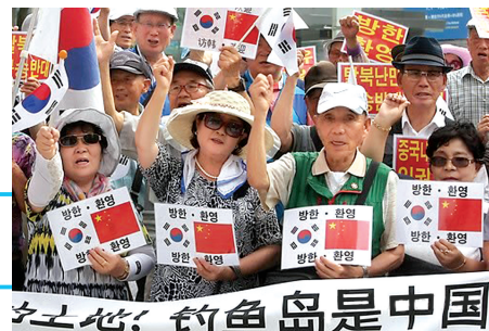
钓鱼岛是中国的土地