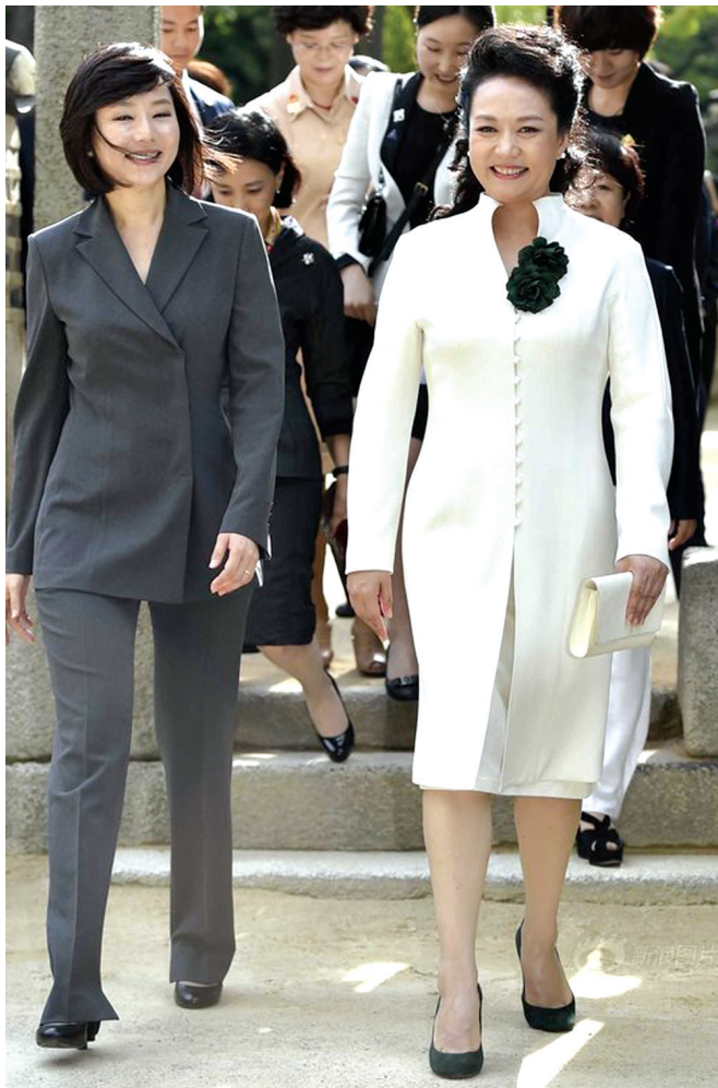
韩“第一夫人”赵允旋(左)陪同彭丽媛参观

应韩国总统朴槿惠邀请,中国国家主席习近平于7月3日至4日对韩国进行国事访问。这是习近平就任国家主席后对韩国的首次访问,也是首次专程访问一个国家。韩方特地对习近平夫人彭丽媛发出邀请,并安排韩国政务首席秘书官赵允旋代行“第一夫人”职责,接待彭丽媛。