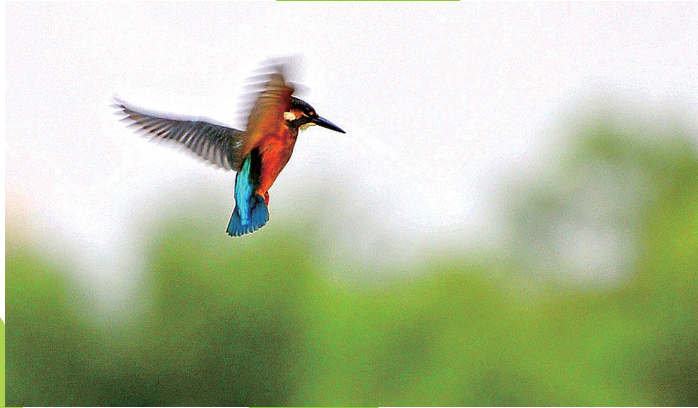
小翠鸟飞行在回家的途中。