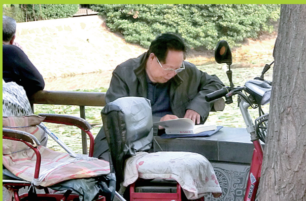
书之乐 拍摄地点:紫荆山公园 坐在湖畔,一位市民沉浸在阅读的乐趣中。