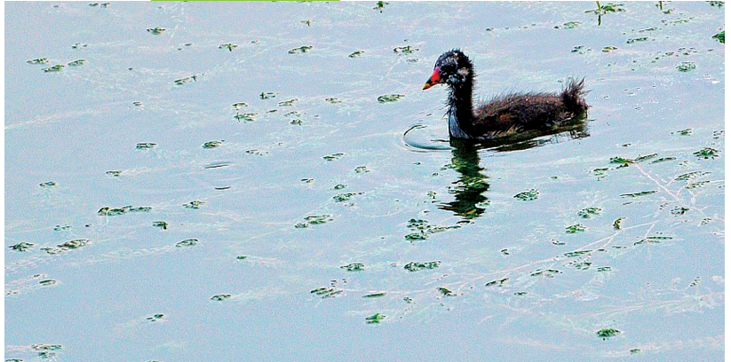
一只鸭崽刚刚学会游泳,就自己出来戏水。