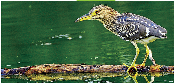
一只鹭鸟走在湖面一根木榻上。