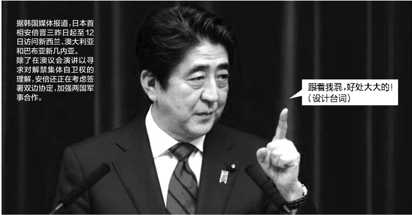
跟着我混,好处大大的! (设计台词)

据韩国媒体报道,日本首相安倍晋三昨日起至12日访问新西兰、澳大利亚和巴布亚新几内亚。除了对解禁集体自卫权的理解,安倍还正在考虑签署双边协定,加强两国军事合作。