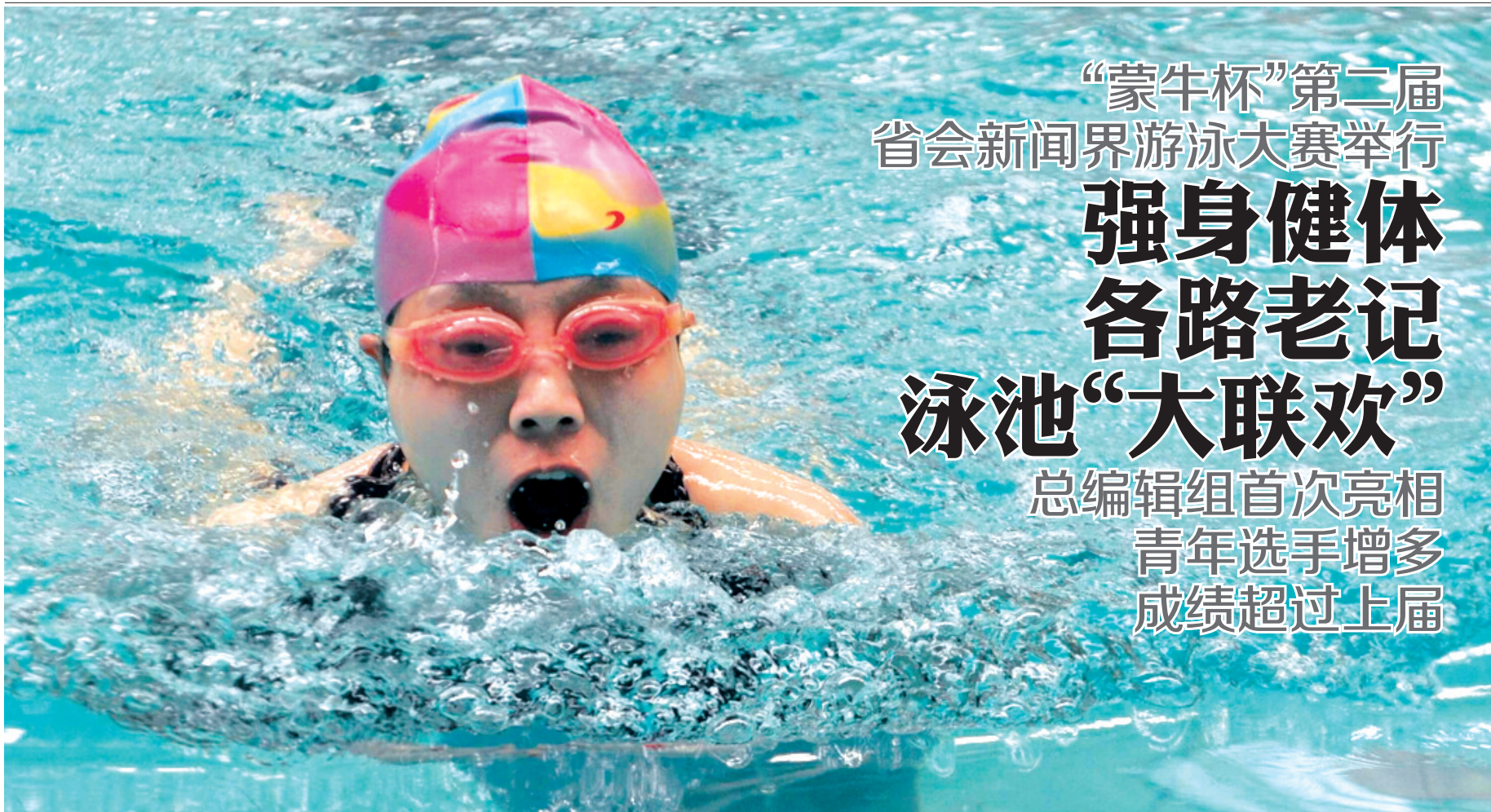
参赛女选手正全力冲刺。