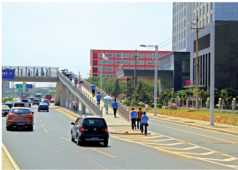
郑飞公司门前,300多工人上下班需要穿越车流上下天桥。