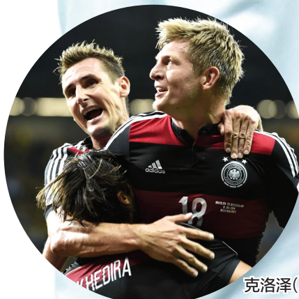
克洛泽(左)和队友庆祝

德国队脱胎换骨的最根本原因还是风格的改变。自从勒夫正式接手德国国家队帅印以来,在以他为首的改革派带领下,德国足球开始了一股技术化风潮。曾经的德国战车少了一分庄严铁血,多了几成轻盈灵巧,像厄齐尔、博阿滕等移民后代也同穆勒、诺伊尔等本土德国人一同,支撑起了德国足球的天地。