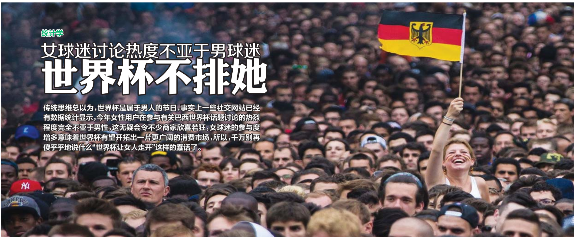
德国与法国1/4决赛时，一名德国女孩在众多法国男球迷中很打眼。

传统思维总以为，世界杯是属于男人的节日，事实上一些社交网站已经有数据统计显示，今年女性用户在参与有关巴西世界杯话题讨论的热烈程度完全不亚于男性，这无疑会令不少商家欣喜若狂，女球迷的参与度增多意味着世界杯有望开拓出一片更广阔的消费市场，所以，千万别再傻乎乎地说什么“世界杯让女人走开”这样的蠢话了。