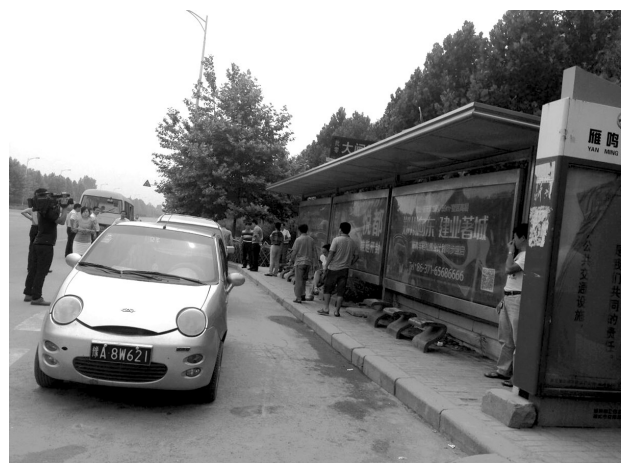
雁鸣湖站牌处,等着拉客的非法营运车辆不少。

车辆随意变道调头、沿途商贩占道经营、公交站牌附近非法营运……根据我市“三城联创”工作要求,从昨日起,市文明办联合中牟县、郑东新区管委会、市公安局、市城管局、市园林局、市交通委、郑开大道市政管理处等部门对郑开大道安全畅通,提升道路参与者和沿途群众的文明素质。