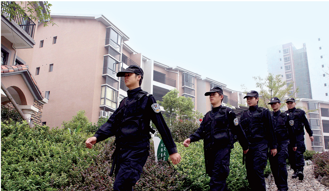
新合鑫·观悦聘请全国物业服务综合实力百强企业,国家一级资质物业管理企业——珠江物业全力担纲观悦物业服务