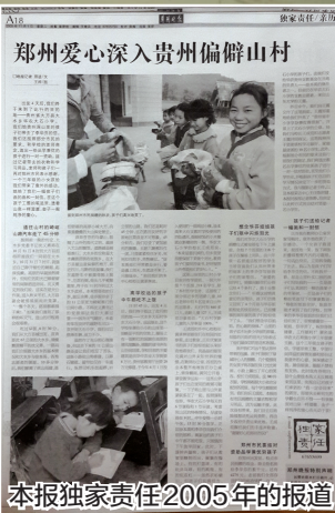
本报独家责任2005年的报道