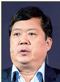
三星电子大中华区总裁 朴载淳