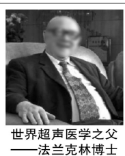
世界超声医学之父——弗兰克林博士

1995年3月,德国“UHD计划”(超声医学心脏探索计划)在弗兰克林生命研究中心秘密展开。18年后,德国联邦卫生部向全球医学界发表公开声明:因为一种尖端科学技术的成功介入,非药物、非手术溶解血栓、软化心血管、提高血管弹性、降低血脂已经成为医学现实,人类历史上第一次实现了心脏病治疗——不吃药、免支架、不搭桥、不住院的革命性突破。