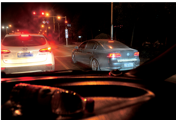
前面两辆车一直跟随执法车辆。