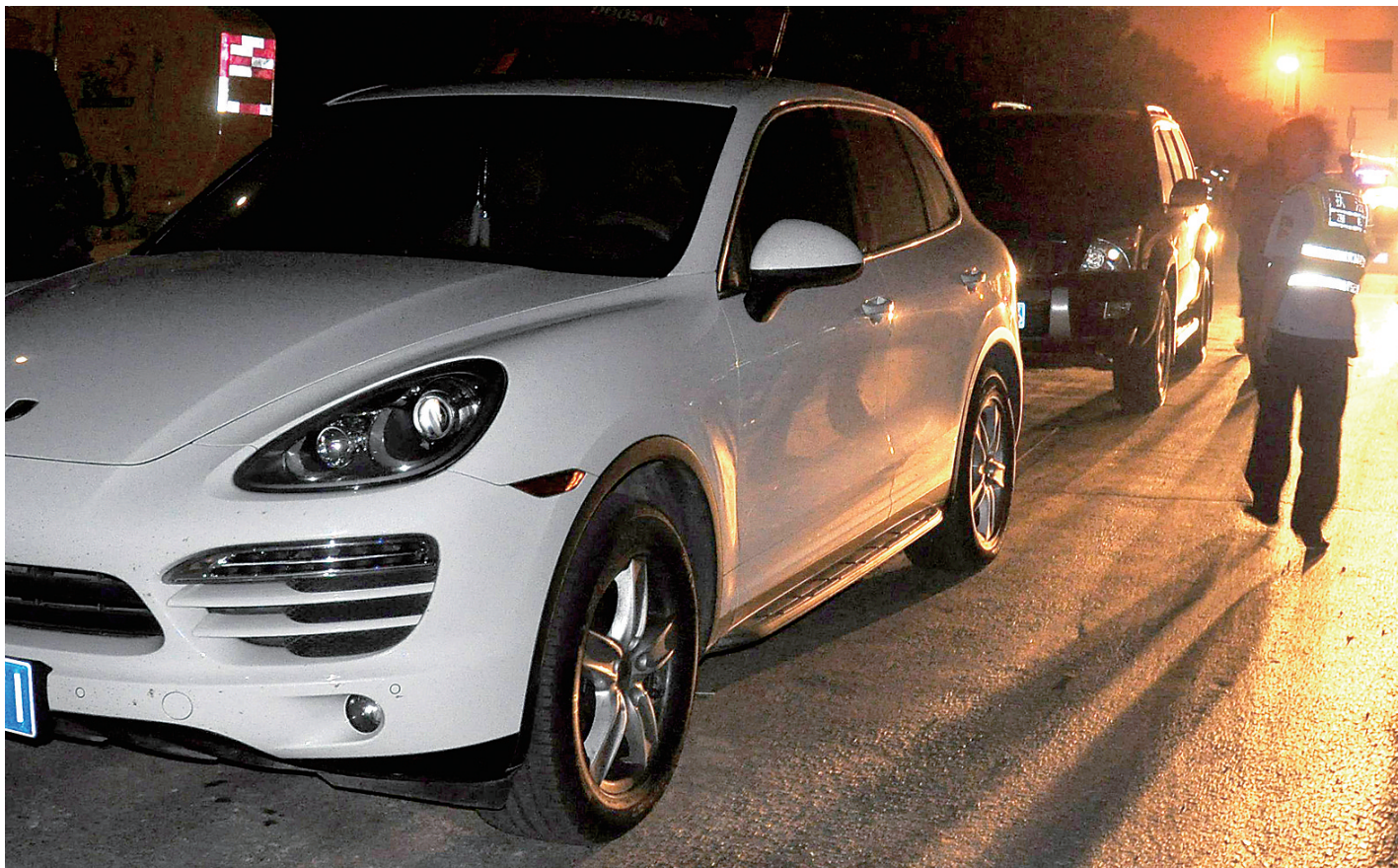
在执法车队的后面,全程跟踪执法人员的社会车辆,不乏保时捷等豪车。