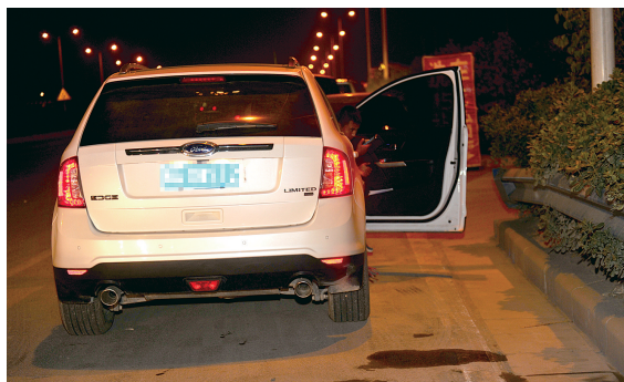
执法车停靠,一社会车辆也立马停在路边。

跟踪的车辆中,以保时捷、凯迪拉克、牧马人等豪车居多,大多数车辆对执法人员只观看不说话。