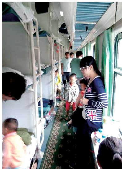
卧铺车厢内乘客情绪稳定