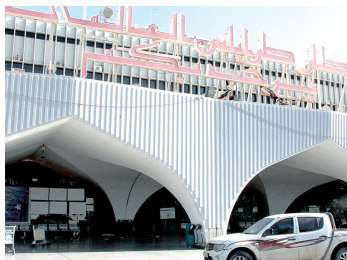
一辆民兵武装的车辆停在航站楼前

利比亚宗教民兵武装17日发射多枚火箭弹袭击的黎波里国际机场航站楼，连续第5天攻击驻守机场的世俗派武装。现阶段，所有进出港航班已全部取消，利比亚空中交通陷入瘫痪。