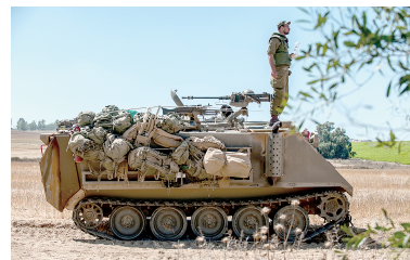
一名以军士兵站在装甲车上休息

以色列军方18日宣布一名以军士兵阵亡。这是以军对巴勒斯坦加沙地带实施地面战以来首名死亡的以色列士兵。