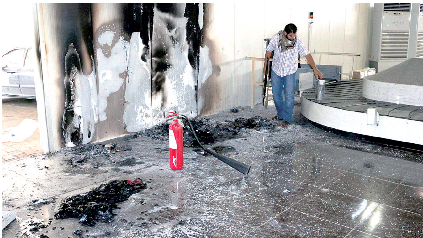
火箭弹袭击后的航站楼内部