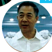
薄熙来 查处程序历时一年半左右