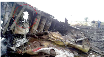
马航客机残骸发现疑似弹孔