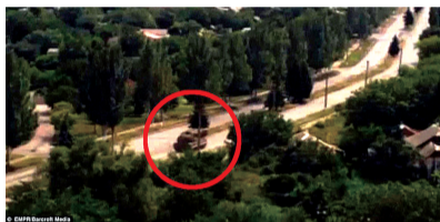
疑似击落MH17的导弹发射器曝光,图为在多列士的一座小镇拍下的画面,距离坠机地点约为16公里