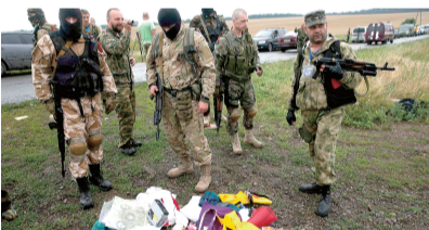
飞机坠落现场遭破坏