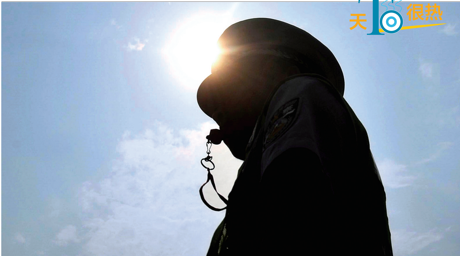
昨日下午3时,二七广场,交警顶着烈日指挥交通