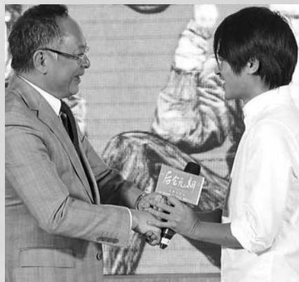
很少夸人的杜SIR也来捧场,韩少面子真大!